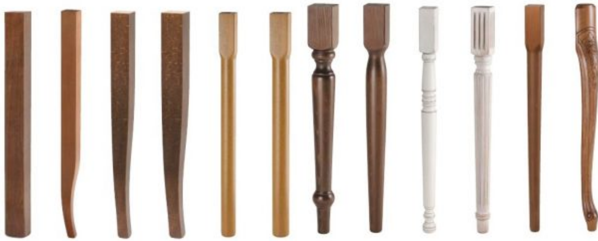
■ Q 73 ■ S 53 ■ S 63 ■ S 73 ■ T 53 ■ T 63 ■ C 83 ■ D 73 ■ F 53 ■ G 63 ■ L 53 ■ H 9